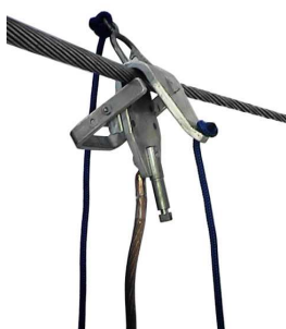
2.Zacisk w pozycji pracy