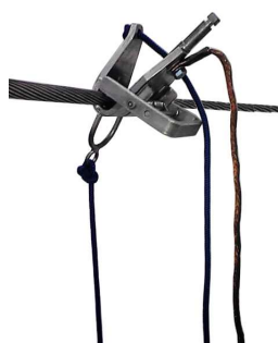
3.Zdejmowanie zacisku z linii