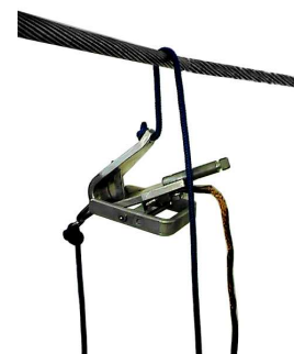
4.Opuszczanie zacisku na ziemię