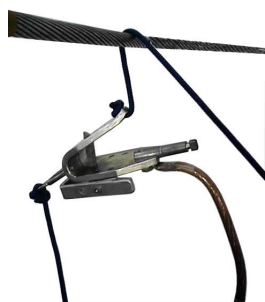
1.Wciąganie zacisku na linię