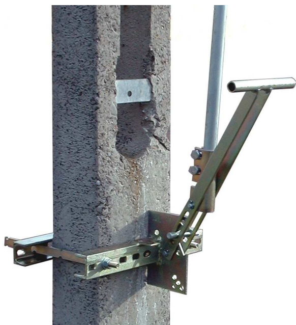
Napęd typ NRUkp-2